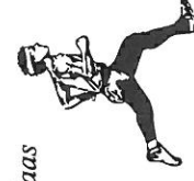
Fritt etter Medaas